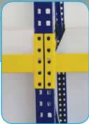
Ağır Hizmet Raf Sistemleri