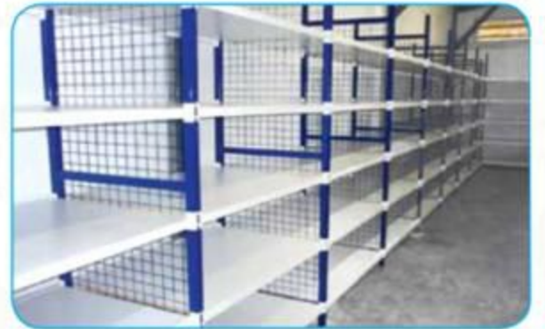
Orta Hizmet Raf