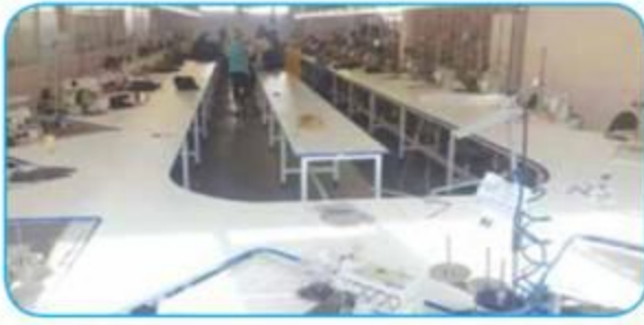
U Dönüflü Z Bant