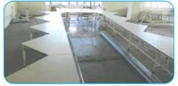
U Dönüflü Z Bant