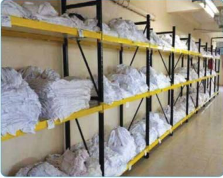
Orta Hizmet Raf