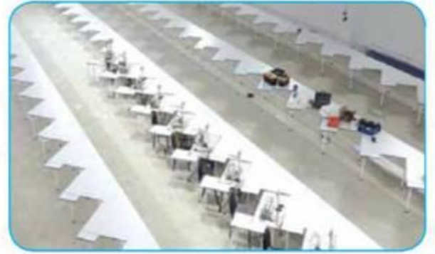
Kol Dayamalı Z Bant