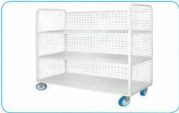
Üç Katlı Tekerlekli Hasır Tel Raf