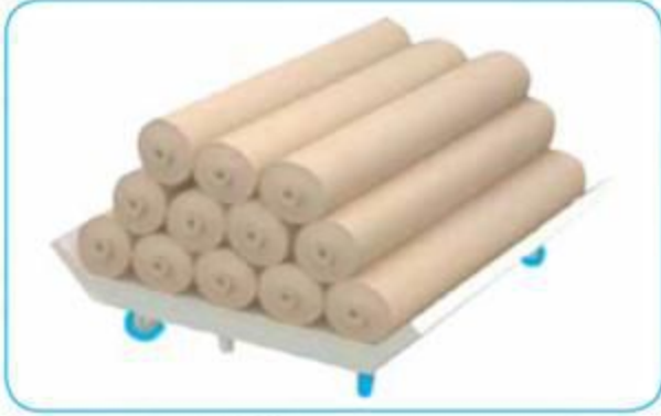
Top Kumaş Taşıma Arabası