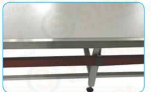
Havalı Masa / Pneumatic Table