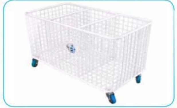
Üç Gözlü Hasır Tel Sepet