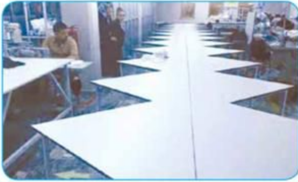
Bitişik Z Bant