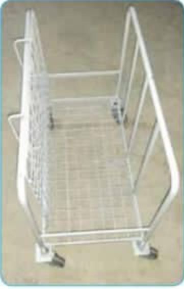
Çift Siperli Mal Taşıma Arabası