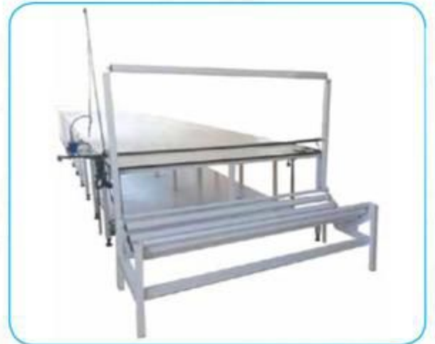
Avare Borulu Top Çözücü