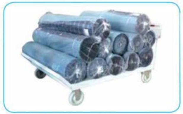
Tek Siperli Eğimli Mal Taşıma Arabası