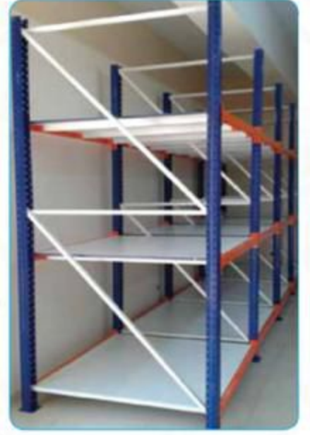
Ađır Hizmet Raf