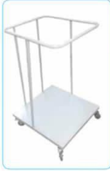
Çöp ve Fire Arabası