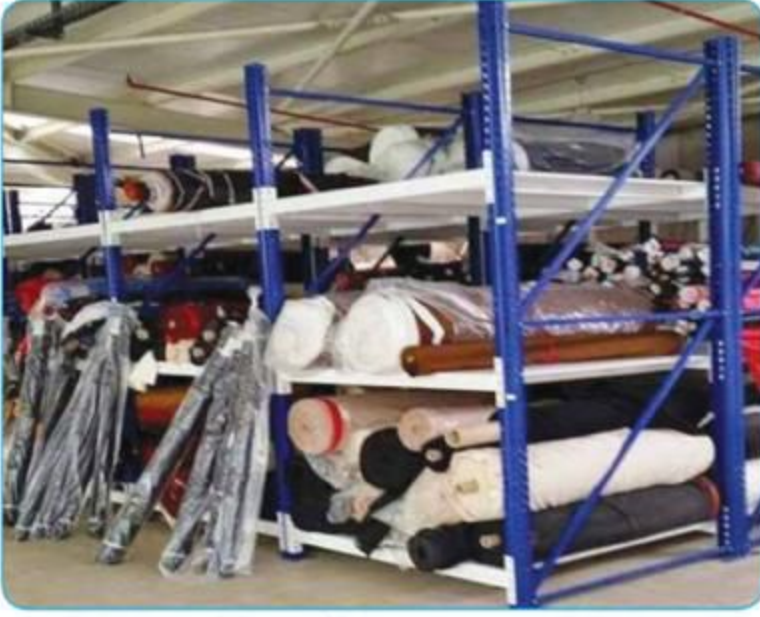
Ađır Hizmet Raf