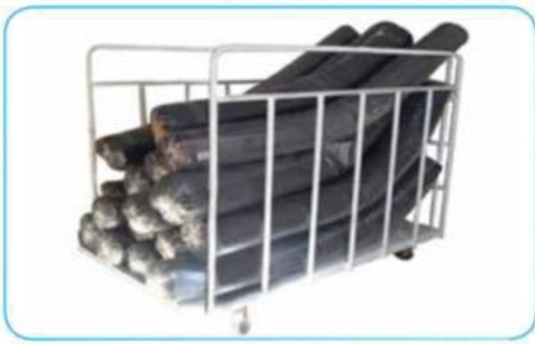
Çift Siperli Uzun Taraf Mal Taşıma Arabası