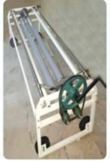
Kumaş Top Taşıma Serim Arabası