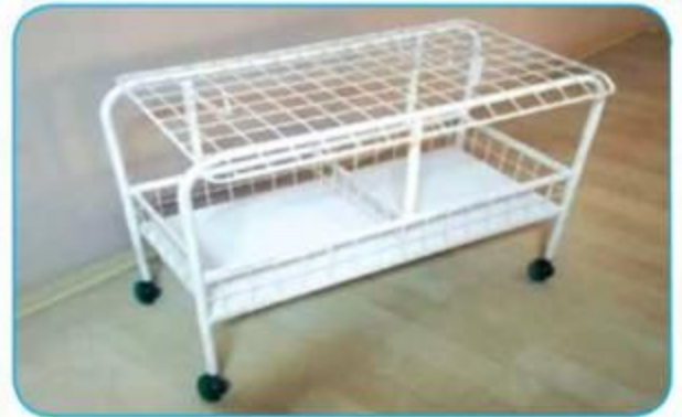
Tekerlekli Demet Arabası